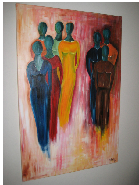
Schilderij van Marcel Heijne

Kom op zaterdag 1 en zondag 2 oktober van 11.00 – 17.30 uur naar de Wildacker!!